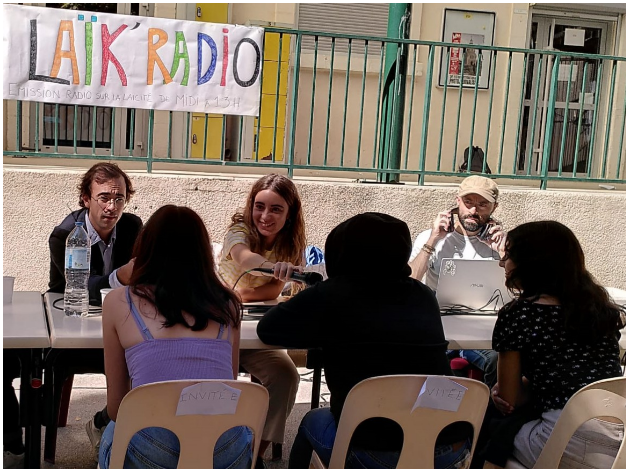
Moment d'interview de la Laïk Radio.

Le concept de ce spectacle participatif séduit les élèves, ils se montrent enthousiastes et attentifs. Cela pose les bases d'un dialogue profond au sujet de la différence entre les savoirs et les croyances, de la tolérance et de la discrimination ( de race, de genre, de position sociale), et peut ouvrir à des sujets tel que la radicalisation, le harcèlement ou encore la différence culturelle.