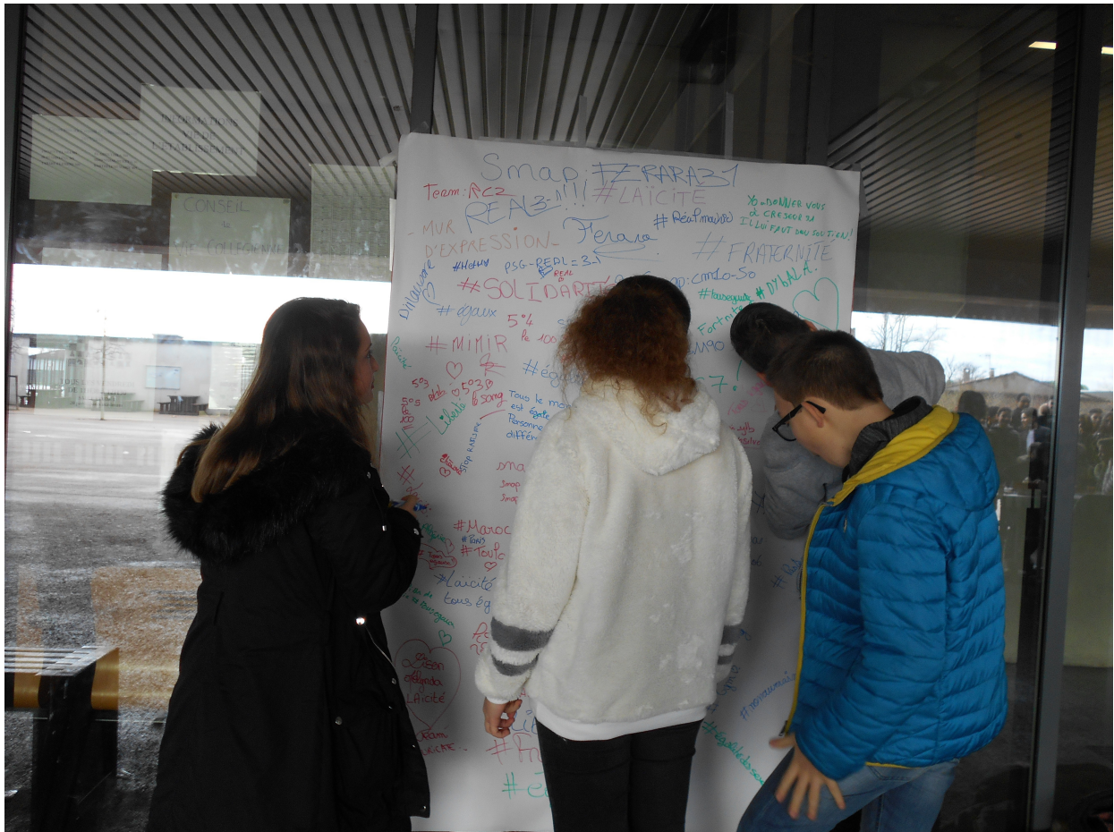
Mur d'expression à disposition des élèves.